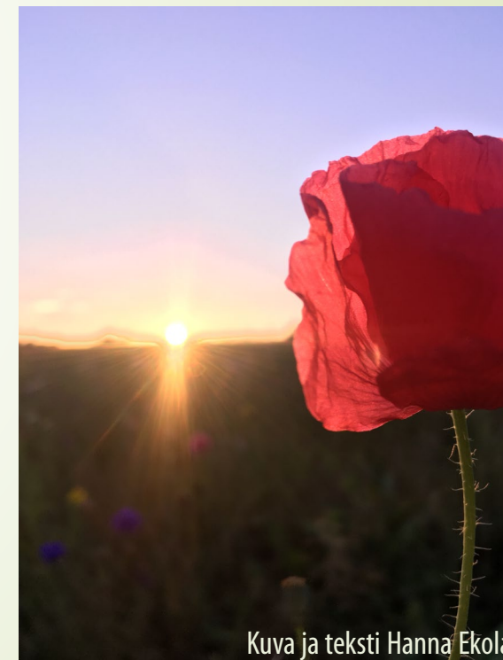
Kuva ja teksti Hanna Ekola

Tänään suostun salaisuuksiin, en enää kysy: miksi? Aika kyllä muuttaa sumut läpinäkyviksi.