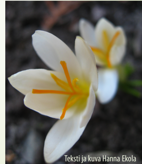
Teksti ja kuva Hanna Ekola