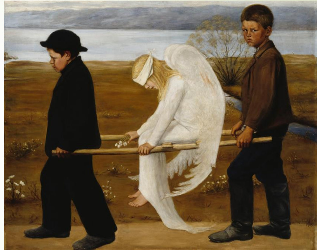
Haavoittunut enkeli, Hugo Simberg 1903. Kansallisgalleria.