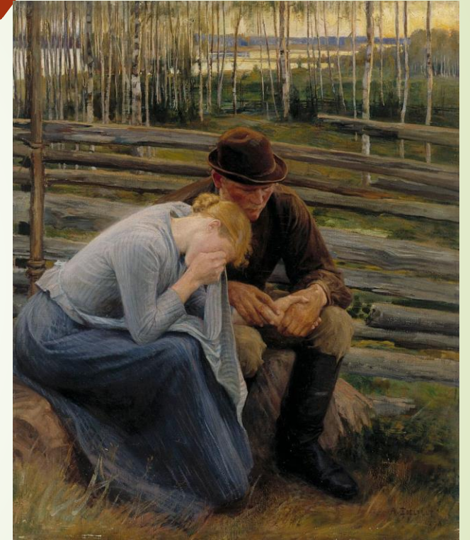
Suru, Albert Edelfelt 1854. Kansallisgalleria.