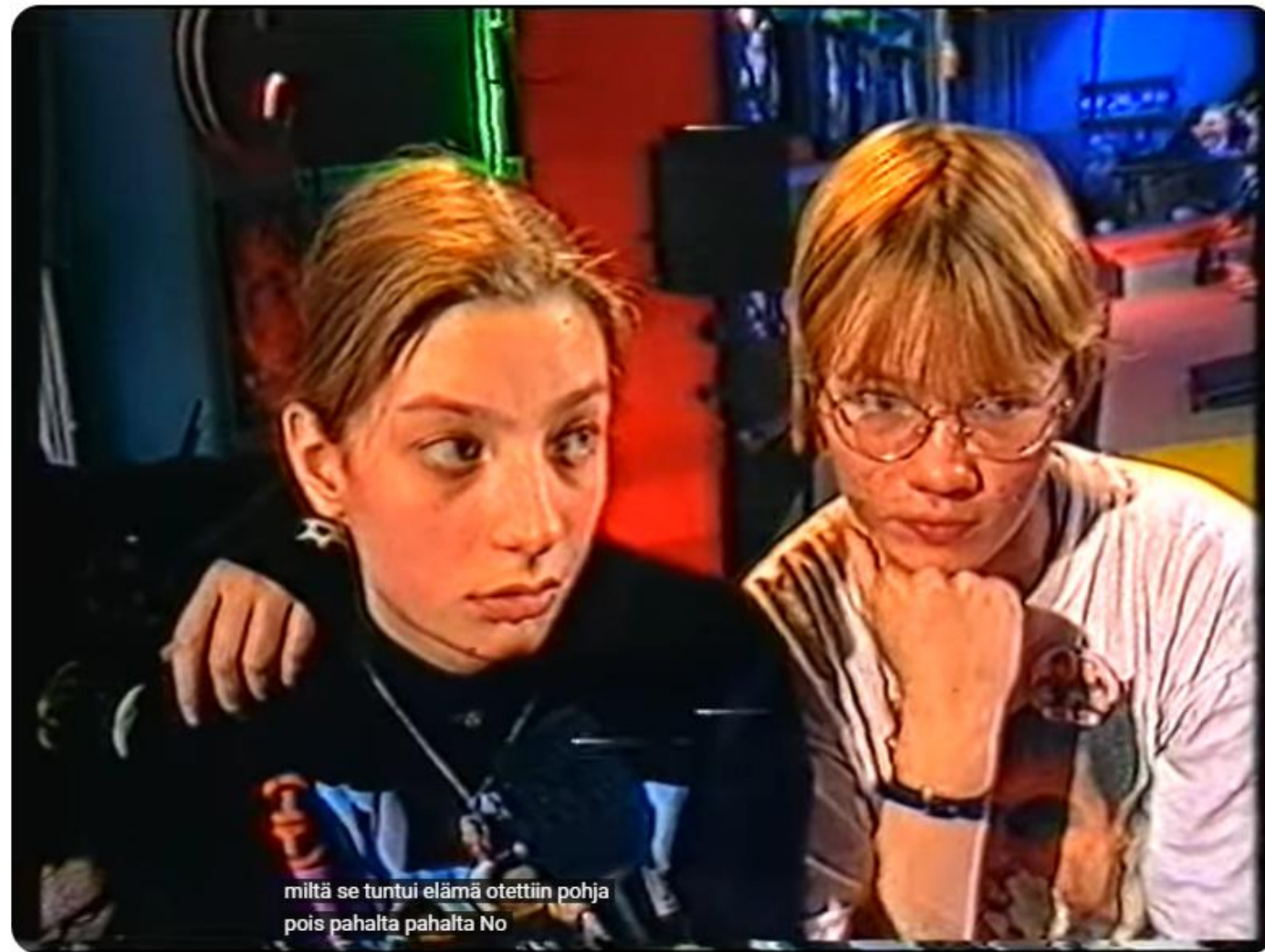
Take That -fanien haastattelu Jyrkissä 1996